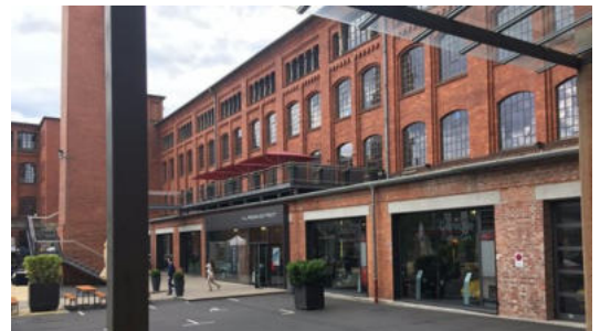
Klassikstadt, Frankfurt am Main